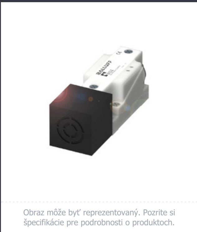
Obraz môže byť reprezentovaný. Pozrite si špecifikácie pre podrobnosti o produktoch.